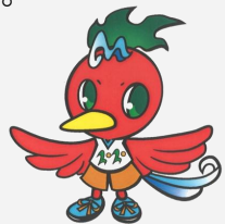
マスコットキャラクター 「フェニたん」

今回寄贈されたAED搭載電動スクーターは、CO2排出ゼロ。 環境に配慮した電動スクーターで、家庭用の電源により充電ができるものです。